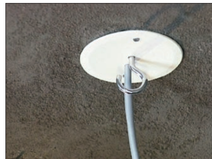
Obr. 8. Krabice KBT zakrytá víčkem V 68 S s vyvedeným vodičem a lustrhákem KBP

ni, zatečení betonové směsi do trubek, tepelnému namáhání při ohřevu betonové směsi do +90 °C a nízkým teplotám při montáži v zimním období do -5, popř. -15 °C. Elektroinstalací úložný program do betonu z Koposu vyhovuje všem těmto požadavkům.