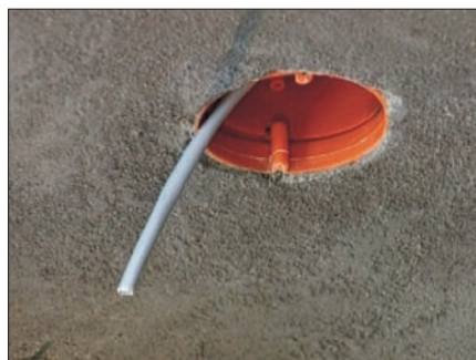
Obr. 7. Krabice KBT s vyvedeným vodičem připravená pro montáž lustrháku KBP

trubky do maximálního rozměru 25 mm, tj. trubky Kopos vyrobené podle EN, např. 2325/LPE-1.