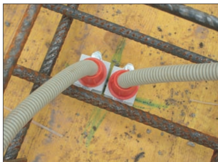
Obr. 5. Příklad použití vývodky a koncovky