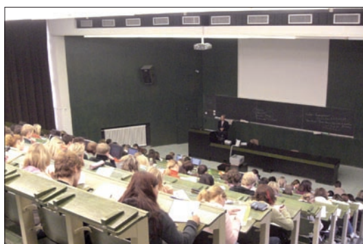
Obr. 2. Dnes je již posluchárna, kde se ARTEZ 2008 uskutečnil, opět plná studentů

ně nárůstu sortimentu a technické vyspělosti přístrojů, složitosti elektroinstalace a kombinování silových, komunikačních a sdělovacích vedení se kvalifikace reviz-