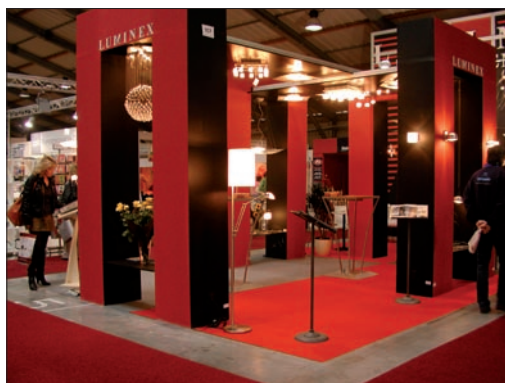
Obr. 3. Luminex

V sekci osvětlení již tradičně vystavovaly společnosti Hagos nebo Artemide, výhradně nabízející luxusní moderní svítidla zahraničních designérů určená pro solventní zákazníky s vytříbeným vkusem. Firma Luminex se prezentovala ještě výpravnější expozicí než v minulém ročníku, kdy byl o její vystavené exponáty takový zájem, že byly poslední den veletrhu téměř všechny rozebrány. V opticky členitém prostoru této expozice byla opět zastoupena svítidla od jednodušších, ryze účelových až po luxusní, tzv. de-