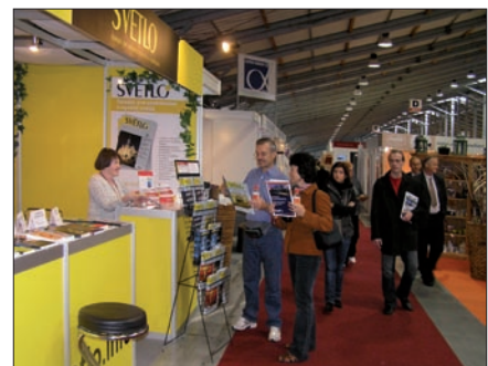
Obr. 5. Časopis Světlo

svítidla v expozici firmy Richard Kanta - Skloart. Nováčkem byly letos společnosti Legrand s bohatou nabídkou vypínačů, zásuvek a prodlužovacích kabelů a firma Philips ČR, divize Lighting, prezentující se svým firemním časopisem Phil.