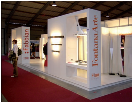
Obr. 1. Hagos

V podzimních dnech 4. až 7. října 2007 patřil Pražský veletržní areál Letňany opět po roce přehlídce moderního interiérového vybavení, doplněné tentokrát nabídkou všeho, co souvisí se zdravým životním stylem (lázeňství, rehabilitace,