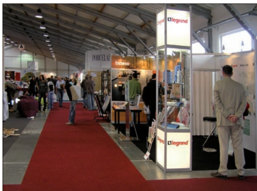
Obr. 2. Legrand

regenerace a estetika) a vybavením pro hotely a restaurace. Dvanáctý mezinárodní kontraktačně prodejní veletrh interiérů Tendence tentokrát spolu s veletrhy Wellness Balnea a Gastroset navázal na úspěch minulých ročníků. Na výstavní ploše 18 013 m 2 své produkty představilo 271 vystavovatelů z Čech a zahraničí (Makedonie, Malajsie, Německo, Nizozemí, Polsko, Slovensko, Sýrie). Během čtyř dnů prošlo branami výstaviště 32 200 návštěvníků.