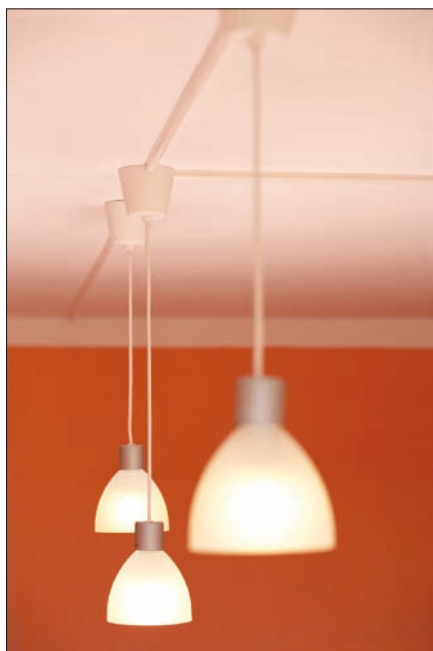
Obr. 1. Stropní lišty ve standardní bílé barvě

Kopos Kolín a. s. vyrábí široký sortiment elektroinstalačního úložného materiálu vhodného pro rekonstrukce panelových bytů a domů. V sortimentu nechybí výrobky pro rekonstrukce bytových i společných prostor: elektroinstalační krabice pod omítku a do dutých stěn, rozvodné krabice, elektroinstalační lišty, parapetní kanály, ohebné a ocelové trubky, kabelové nosné systémy. Výrobky Koposu splňují přísné požadavky na bezpečnost. Využití systémů lištových a parapetních soustav zajišťuje čistou, jednoduchou a bezprašnou montáž pro elektrická a datová vedení na povrchu stěn (rekonstrukce probíhá za plného provozu v panelovém domě). Aktuální design výrobků Koposu je obzvláště vhodný do všech moderních bytových interiérů.