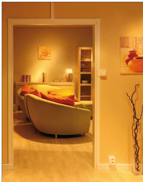
Obr. 3. Estetická rekonstrukce rozvodů v panelovém bytě

tuhé trubky), tak i uvnitř budov. Pro vnitřní použití v domech lze vybrat z uzavřeného provedení rekonstruovaných rozvodů (tuhé a ohebné plastové trubky, tuhé bezhalogenové trubky, pancéřové trubky spolu s krabicemi s vysokým krytím). Z otevřeného provedení rozvodů jde především o kovové nosné systémy nebo drátěné žlaby, o rozváděčové kanály, požárně odolné trasy nebo o provedení v lištách (zaklapávací a hranaté lišty