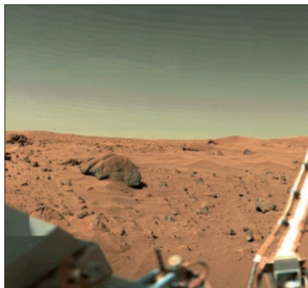
Obr. 4. Předpokládaný pohled po přistání sondy Phoenix

štit. Po jeho odhození bude sestup pokračovat na padáku. Ten ovšem není v řídké atmosféře Marsu schopen zajistit měkké přistání automatu. Hustota prostředí u povrchu Marsu odpovídá té pozemské ve výšce asi třiceti kilometrů.