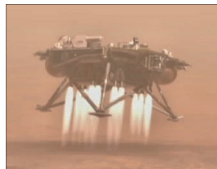
Obr. 2. Předpokládaný přistávací manévry sondy Phoenix v květnu příštího roku

Podobným přístrojem, alespoň z hlediska koncepce práce, je MECA ( Microscopy, Electrochemistry and Conductivity Analyzer ), který obsahuje mokrou laboratoř, optický a atomový mikroskop a sondu pro měře-