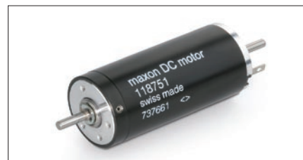
Obr. 5. Komutátorový motor Maxon RE 25

NASA použila komutátorové motory Maxon i v dřívějších přístrojích při misích na Mars. Mobilní robot z roku 1997, pojmenovaný Sojourner, obsahoval jedenáct motorů Maxon. Funkce každého ze dvou dalších robotů, Spirit a Opportunity, jsou ovládány 39 motory Maxon.