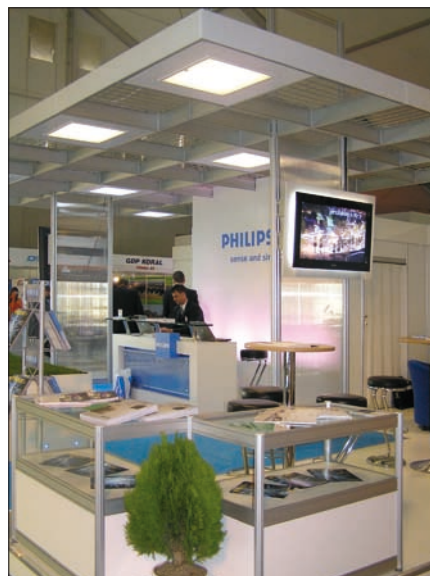
Obr. 2. Elegantní expozice Philips Slovakia

soustav, Vysokotlaké halogenidové výbojky v praxi aj.). Odborným garantem semináře byla společnost Comlux. Na aktuální téma byl zaměřen seminář Přechod na