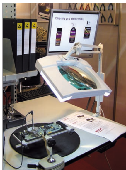
Obr. 3. Praktické svítidlo s lupou společnosti Garoma Plus z Brna (za příznivou cenu)