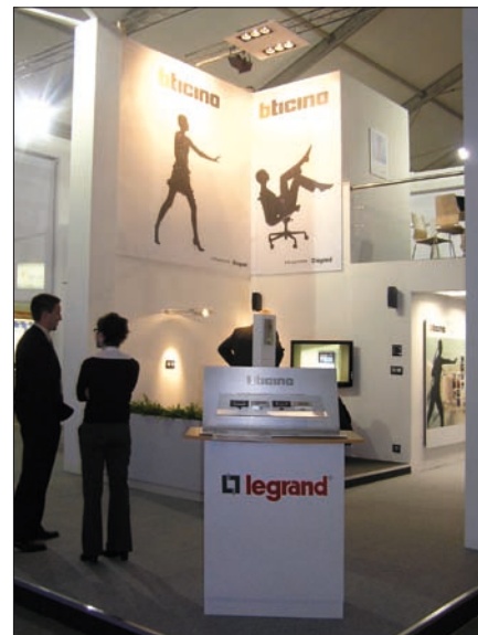
Obr. 4. Legrand Slovensko – vítěz soutěže Nejhezčí expozice veletrhu ELO SYS 2007

euro aneb ani mince nazmar, který připravila Slovenská asociácia malých podnikov ve spolupráci s Cechem elektrotechnikov Slovenska.