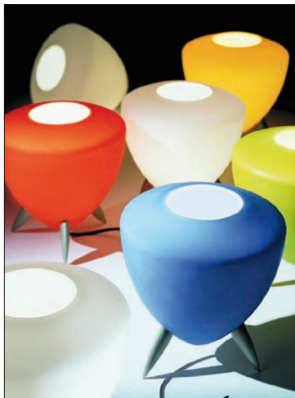
Obr. 12. Inside Gilda

typ svítidel je možné přiřadit ke sledování televizní obrazovky –lepší se tak světelná pohoda snížením jasů okolních ploch a předmětů (v tomto případě nemůže být vlastní svítidlo v zorném poli očí člověka). Podobně lze zlepšit světelné poměry prostoru při dalších lokálních činnostech – při čtení u malého svítidla pouze pro čtení, při poslechu hudby apod. Přítmí restaurace je rovněž ideálním místem pro navození atmosféry prostřednictvím svítícího barevného objektu (obr. 3, obr. 4).