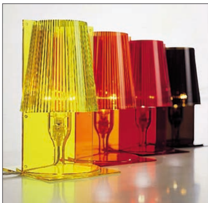
Obr. 3, 4. Kartell – Take, design Ferruccio Laviani, výška 30 cm, žárovka 40 W, polykarbonát, devět barevných verzí, cena včetně DPH 2 090 Kč

svítilna. Poskytují spíše estetický zážitek, jsou objektem, který na sebe soustřeďuje pozornost. Proto by bylo možné soudit, že jde, minimálně ze světelnotechnického hlediska, o svítilna nadbytečná. Ale i tato svítilna mají své opodstatnění, dokonce naopak – mohou být onou „třešničkou na dortu“. Obvyklá je kombinace s jiným – hlavním – osvětlením. Ideální je vzájemně skloubit dominující výtvarnou stránku se světelnou.