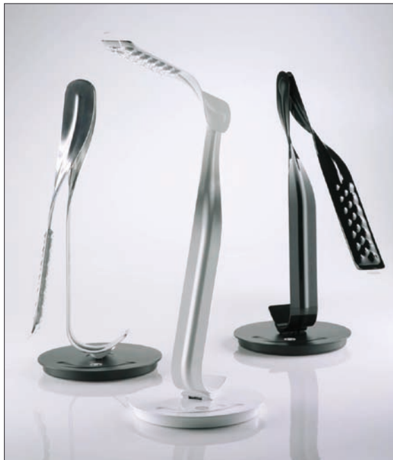
Obr. 10. Herman – Miller Leaf, design Yves Béhar (ateliér Fuseproject), výška při sklopeném rameni 51 cm, maximální výška 93 cm, 20 LED asi 9 W, hliník, 13 982Kč bez DPH