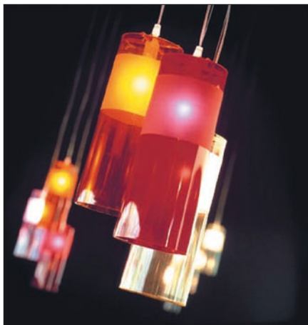
Obr. 11. Kartell – Easy, design Ferruccio Laviani, výška 33 cm, závěs 190 cm, 40W žárovka, polykarbonát, sedm barevných verzí, 2675 Kč včetně DPH

kovému podružnému osvětlení prostoru. Uvedená svítidla mohou tedy být tam, kde postačují nízké hladiny osvětlení (např. komunikační prostory) – obr. 2. Uplatní se především v interiérech s požadavkem na nízkou hladinu osvětlení pro vytvoření určité atmosféry – nálady. Vhodně zvolené