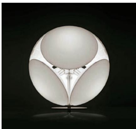
Obr. 1. Foscarini – Bubble Table, design Valerio Bortin, 2000, průměr 50 cm, výška 51 cm, 6x 40W žárovka, polykarbonát, cena 17 512 Kč bez DPH

V minulém příspěvku – první části článku o stolních svítilnách, jsem avizoval, že druhá část bude zaměřena na stolní svítilny jakožto světelné objekty. Protože ale svítilny mají často více mutací, jednotlivé typy svítilen se vzájemně doplňují (např. stolní a stojanová svítilna), pojal jsem text širěji. Místo avizované druhé části zaměřené výhradně na stolní svítilny se proto ve dvou následujících příspěvcích budu věnovat svítilnám – světelným objektům obecněji.