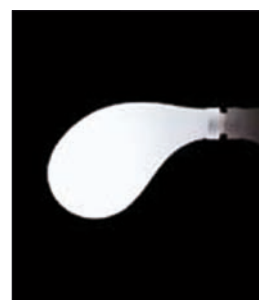
Obr. 6. Kundaalini – Drop, design Future Systems, 2006, délka 22 cm, žárovka 60 W, sklo, 4 927 Kč bez DPH

Mám-li přece jen přiřadit určitou funkci, tedy vedle dekorativní funkce (ve smyslu dekorativní – náladové osvětlení), mohou být tato svítilna využívána jako doplňkové osvětlení místností, chodeb, popř. mohou zcela nahradit jiný typ osvětlení. Například namísto podhledových lokálních žárovkových bodů nebo nástěnných svítilen lze použít svítilící objekty postavené na nábytku a určené k přisvětlení, resp. cel-