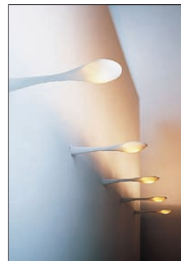
Obr. 5. ANTA – Spoon, design Ostwald und Nolting, délka 230 nebo 420 mm, halopin OSRAM 60 W, porcelán, cena od 5 498 Kč včetně DPH

ným na pohled svítilno (obr.1)? Navíc jde o předmět, který může být příjemný jak ve své základní, nesvítilící podobě, tak jako svítilící objekt. V případě dekorativ-