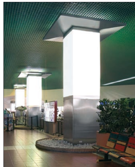
Obr. 13. Fabbian – Totem, základní velikost 120 × 120 × výška 370 cm, zářivky T5 80 W, cena podle konkrétního provedení

Zůstaneme-li u odlišností od ostatních typologických skupin svítidel, u světelných objektů je při jejich posuzování nejdůležitější design (estetická stránka). Neznamená to, že u jiných svítidel člověka vzhled nezajímá. Jsou ale interiéry, kde svítidlo je potlačeno až skryto a uživatel vnímá pouze osvětlený prostor. U dekorativních světelných objektů se bedlivě posuzuje použití a zpracování materiálů, včetně barvy. Posuzuje se barva svítidla ve zhasnutém stavu, zejména ale po rozsvícení, neboť barva stínidla dává charakter světlu, a tím i osvětlovanému prostředí. Výběr světelných objektů zá-