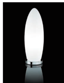
Obr. 7. Kundaalini – Gherkin, design Norman Foster, 2005, výška 32 cm, 63 cm, 120 cm, žárovka 60, 100, 150 W se stmívači, sklo, cena od 7 074 Kč bez DPH