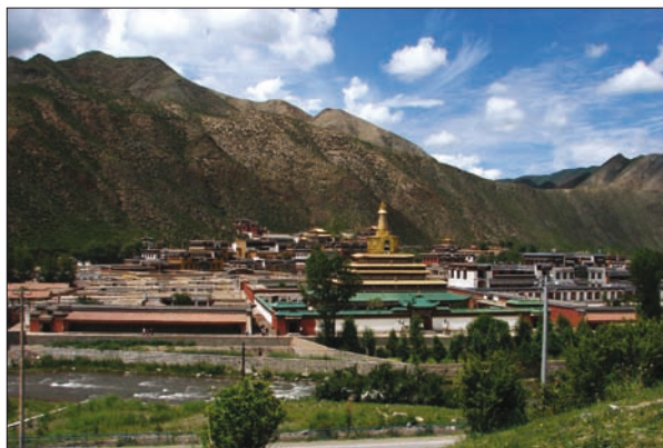
Obr. 10. Lámaistický klášter Labrang, provincie Gansu