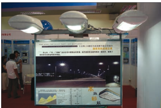
Obr. 3. Svítidla pro veřejné osvětlení s LED, Peking

dny byly věnovány odborné konferenci. Její program byl rozdělen do osmi bloků, v rámci kterých bylo předneseno 100 přednášek a bylo prezentováno více než 200 posterů. V rámci druhé části zasedá-