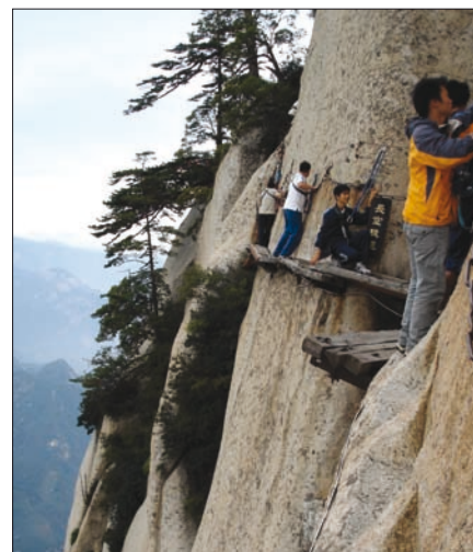
Obr. 11. Stezky v taoistických posvátných horách Hua Shan, provincie Shaanxi