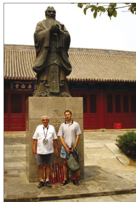
Obr. 4. Konfuciuův chrám, Peking

dny byly věnovány odborné konferenci. Její program byl rozdělen do osmi bloků, v rámci kterých bylo předneseno 100 přednášek a bylo prezentováno více než 200 posterů. V rámci druhé části zasedá-