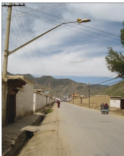
Obr. 9. Veřejné osvětlení, Xiahe, provincie Gansu

Čínská krajina a příroda je různorodá jako čínská kuchyně. Pokud bychom chtěli charakterizovat stav krajiny v současné Číně, bylo by snad možné jako průměr použít dnešní čínskou společnost. Při putování Čínou si člověk všimne obrovských rozdílů v životním stylu i úrovni lidí žijících ve městech a na venkově. Stejně tak velké rozdíly jsou v dnešní čínské krajině. Na jedné straně je to krajina zasažená a devastovaná průmyslovou výrobou, na druhé straně je to nedotčená panenská příroda. Jest-