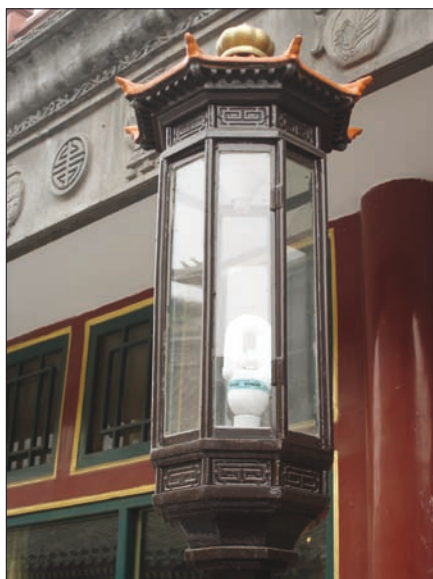
Obr. 8. Indukční výbojky ve veřejném osvětlení, Peking

Jedním z výrazných znaků mohutného rozvoje Číny je obrovská stavební aktivita. Starší šedivá a nudná paneláková zástavba z počátků budování socialismu se nahrazuje „moderní“ zástavbou ze skla, betonu a ocele. Města nenávratně mění