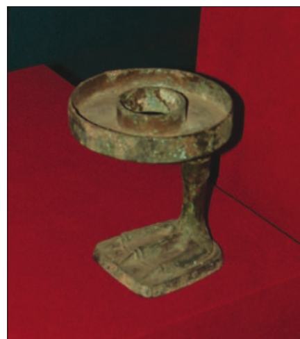
Obr. 12. Bronzová lampa, dynastie Han (202 př. n. l. až 220 n. l.), muzeum provincie Shaanxi, Xian

liže člověk nedisponuje dostatkem času na cestování, zpravidla se setká s krajinou, která se nachází někde mezi popsanými situacemi, přesněji řečeno s krajinou zasaženou turismem. Velkým zážitkem je cestování po posvátných horách a pohořích s taoistickými a buddhistickými kláštéry. Dramatické horské hřebeny, plující mraky, strmé útesy s osamocenými borovicemi, vycházející slunce a gong