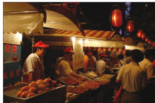
Obr. 5. Noční tržiče, Peking

vydáte. A přibude ještě jedna zkušenost. V Číně lze názorně zakusit, co se skrývá pod pojmem „jazyková bariéra“, a to nejen u mluveného, ale i psaného jazyka. Angličtina zpravidla selhává již v samotném hlavním městě. Mimo něj se až na výjimky stává nepotřebným intelektuálním závažím, místo kterého cestovatel