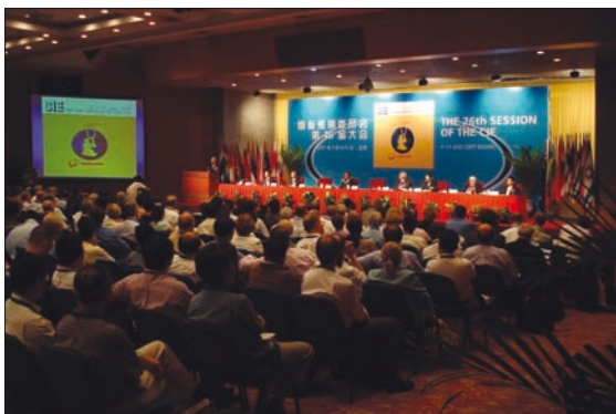
Obr. 1. Zahájení 26. generálního zasedání CIE, Peking

výběr smažených jídel, všudypřítomné taštičky (s masem, zeleninou nebo kartonem ® ), bochánky nebo smažené nudle. V některých pekingských restauracích a tržišťích narazíte i na neobvyklé pokrmy jako žaby, šneky, kobylky, bource, štiny nebo cikády. Při cestě mimo Peking se styl kuchyně mění podle směru, kterým se