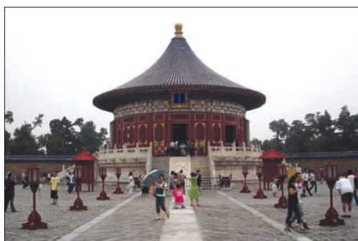
Obr. 7. Chrám Nebes, Peking

postupně začíná využívat jiné části těla, které nejsou primárně určeny ke komunikaci. Opravdovým existenciálním zážitkem se v centru milionového města může stát kombinace střevní příhody a jazykové bariéry, zakončená šokujícím setkáním s veřejným záchodem a jeho dočasnými uživateli.