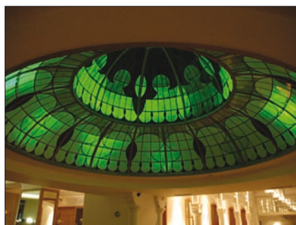
Obr. 2. Traxon Wall Washer XB - 36 – instalace v Park Plaza Victoria, Amsterdam, Nizozemí

Wall Washer XB-36 je moderní, elegantní vysoce výkonné monochromatic-