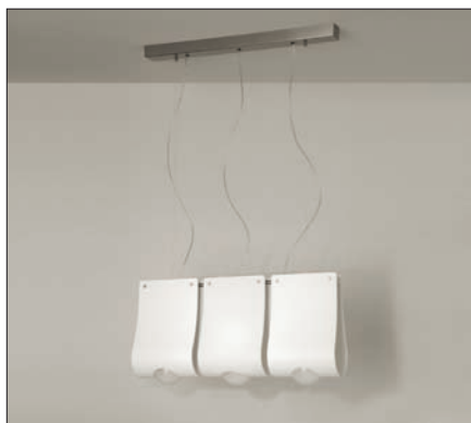
Obr. 5. Závěsné svítidlo Loxia

Všechna skleněná stínidla svítidel Lucis jsou ručně foukaná. Proto je třeba