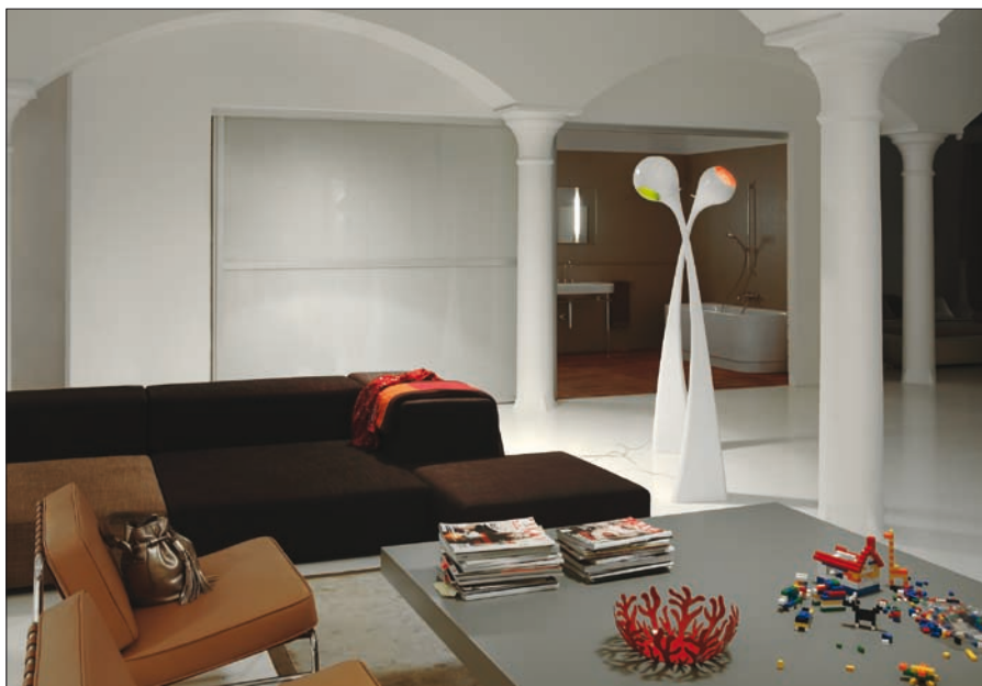
Obr. 1. Stojanové svítidlo Trifid

Spolupráce s mladými designéry přináší do sortimentu společnosti Lucis nejen nová tvarová řešení, ale i nové materiály. Nové technologie umožňují odlišný přístup k tvarování i k pojetí svícení a svítidel