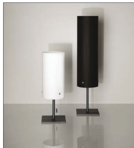
Obr. 9. Stolní svítidla Maia

zákazníky upozornit, že na ručně zpracovaném skle lze pozorovat drobné nepřesnosti, změny barev a tloušťky skla. Každé sklo je originální ruční prací mistra skláře, u něhož nelze očekávat přesnost automatického stroje. Drobné nedostatky a při-