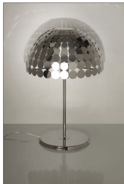
Obr. 3. Stolní svítidlo Pop

Z dalších novinek je možné upozornit na závěsná svítidla Loxia. Jsou vyrobená z umělého kamene Corian, který se vyznačuje vysokou odolností, pevností a dlouhou životností. Umělý kámen se často používá k výrobě kuchyňských pracovních desek. Svítidlo ze stejného materiálu je vhodným doplňkem, který dotváří jednotný vzhled celého interiéru.