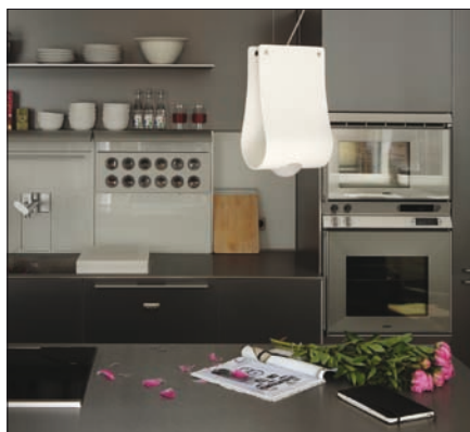
Obr. 4. Závěsné svítidlo Loxia