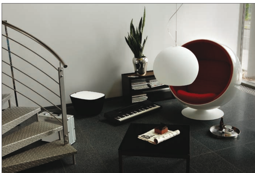
Obr. 8. Závěsné svítidlo Nemesis

ležitostně bublinky ruční řemeslné zpracování skla pouze potvrzují.