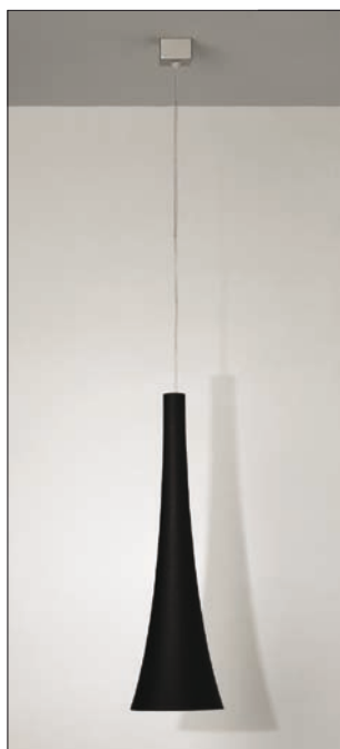
Obr. 6. Závěsné svítidlo Phoebe