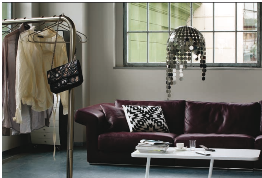
Obr. 2. Závěsné svítidlo Pop

obecně. Svítidlo se stává výrazným designovým prvkem interiéru.