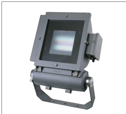
Obr. 1. Svítidlo Contrast Spectra nabízí možnost dynamicky měnit barvu podle přání zákazníka