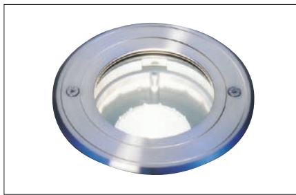
Obr. 4. Svítidlo Mica – vynikající zemní svítidlo

Jedenácté Pražské Quadriennale bylo rozděleno do tří základních výstavních linií: Sekce národních expozic, Studentská sekce Scenofest a Sekce architektury a technologie. Dále bylo zorganizováno mnoho doprovodných programů v Průmyslovém paláci a také projekt Praga Theatralis, který zahrnul všechny akce a programy v pražských ulicích a divadlech. Během deseti dnů, po které se Quadriennale konalo, se návštěvníci seznámili s aktuální diva-