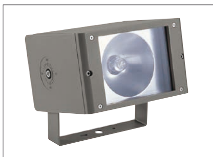
Obr. 2. Svítidlo QBA – kompaktní světlomet s velkým výběrem příslušenství