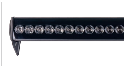
Obr. 3. Svítidlo Band Intensive – novinka v sortimentu firmy – využívá všechny výhody diod LED