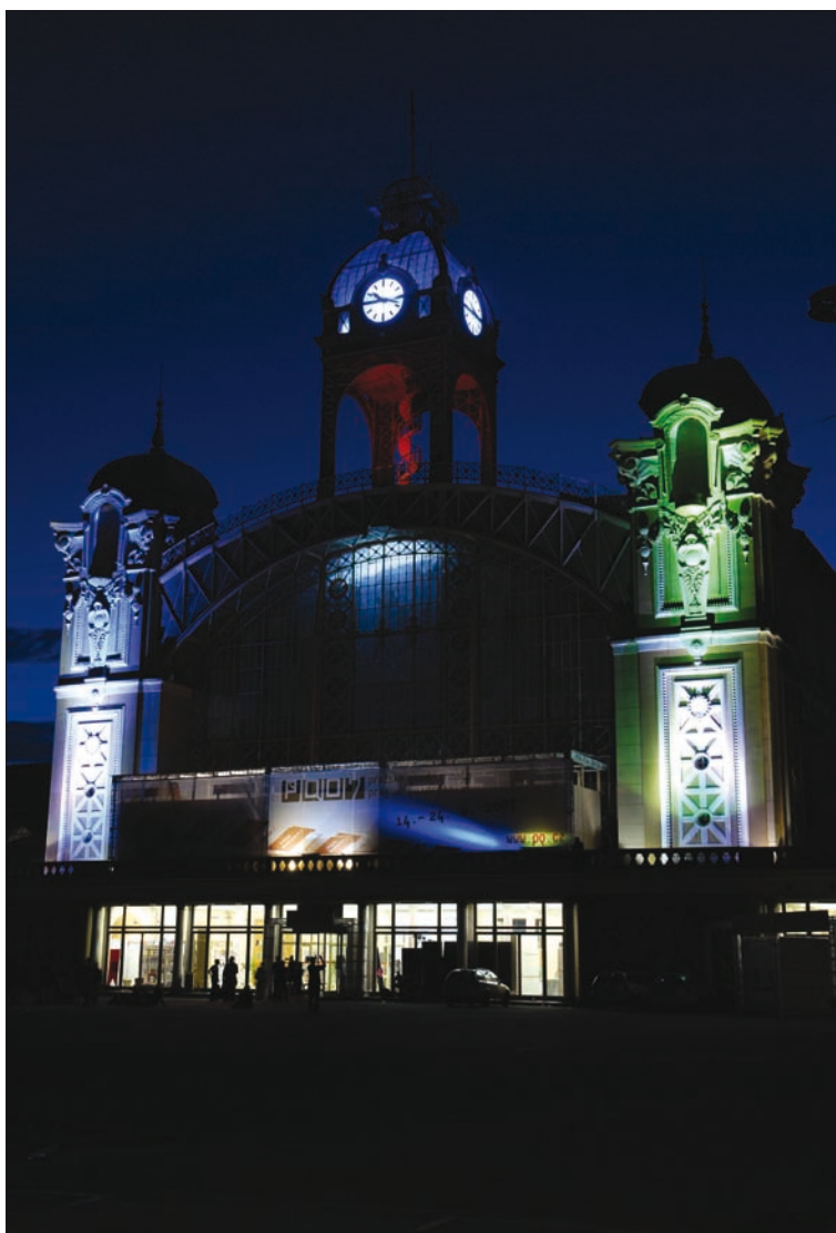
Obr. 5. Slavnostní osvětlení Průmyslového paláce na Výstavišti v Praze