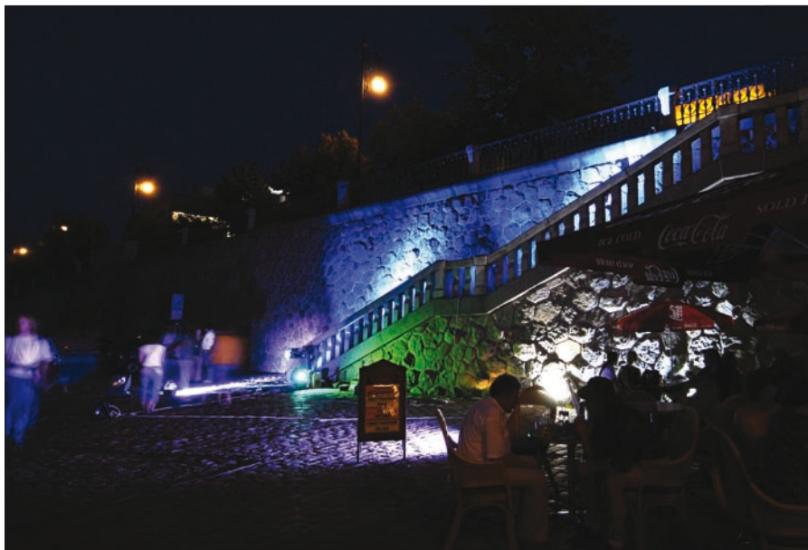
Obr. 6. Osvětlení náplavky u Čechova mostu

dí stojí např. světová premiéra hry Moby Dick pro Canton Players Guild v září 1996.