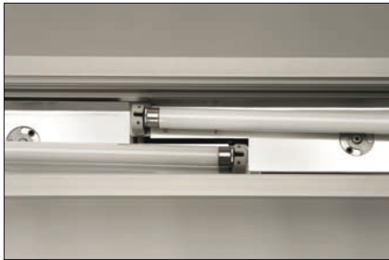
Obr. 1. Spojení dvou vložek v profilu

Při jeho vývoji odborníci vycházeli z velmi oblíbeného svítidla Serie 03 s opalovým krytem. Dosavadní svítidlo vykazo-