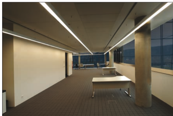
Obr. 4. Realizace se závěsnou variantou svítidla

překrývají, vkládané do profilu (obr. 1). Překrytí zářivek je navrženo tak, aby se u svítidla nemohla projevit charakteristická vlastnost lineárních zářivek, tj. menší jas obou konců zářivkových trubíc. Všechny vložky jsou vybaveny příslušnými elektronickými předřadníky a rozptylnými reflektory. Tyto reflektory zlepšují odraz světla a zvyšují světelnou účinnost svítidla. Matný materiál reflektoru, kte-