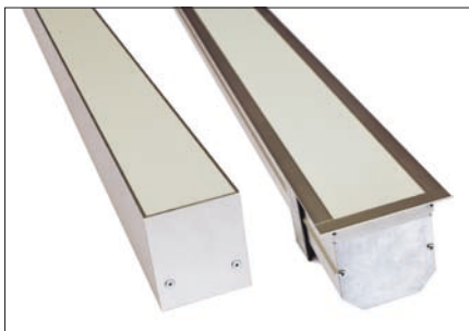
Obr. 2. Závěsná a vestavná varianta svítidla

valo v místech napojení na další profil pokles jasu svítící části. A tudíž úroveň jasu svítící části několika svítidel spojených do pásu byla vždy ve spojích nižší. Svítící pás působil dojmem přerušované linie. Tento efekt byl způsoben nevhodným konstrukčním řešením spojování jednotlivých svítidel. Lineární zdroje jsou totiž v sestavě umístěny sériově za sebou. Minimální rozstup svítících ploch je asi 50 mm.